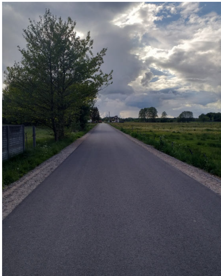
Na zdjęciu: ul. Królewska w msc. Kordowo