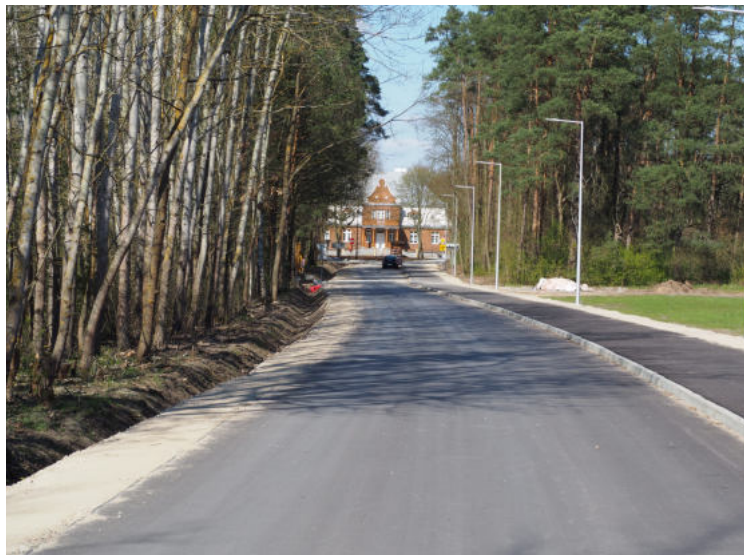
Na zdjęciu: Droga gminna w msc. Przystań

Zabytkowy dworek w Przystani zyskał zupełnie nowe otoczenie infrastrukturalne. Za kwotę blisko 2,2 mln zostały przebudowane okoliczne drogi gminne, powstały nowe ciągi pieszo rowerowe, a całość inwestycji dopełnia stylowe oświetlenie. Wykonawcą robót było Przedsiębiorstwo Robót Drogowo Mostowych „OSTRADA” Sp. z o.o.