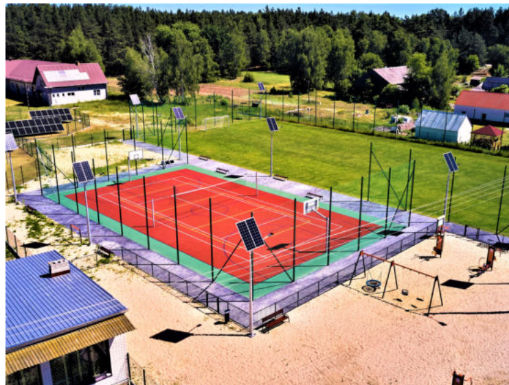
Na zdjęciu: Kompleks sportowy w msc. Stepna Stara