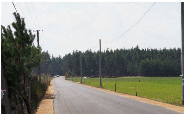
Na zdjęciu: Droga gminna w msc. Żebry-Ostrowy