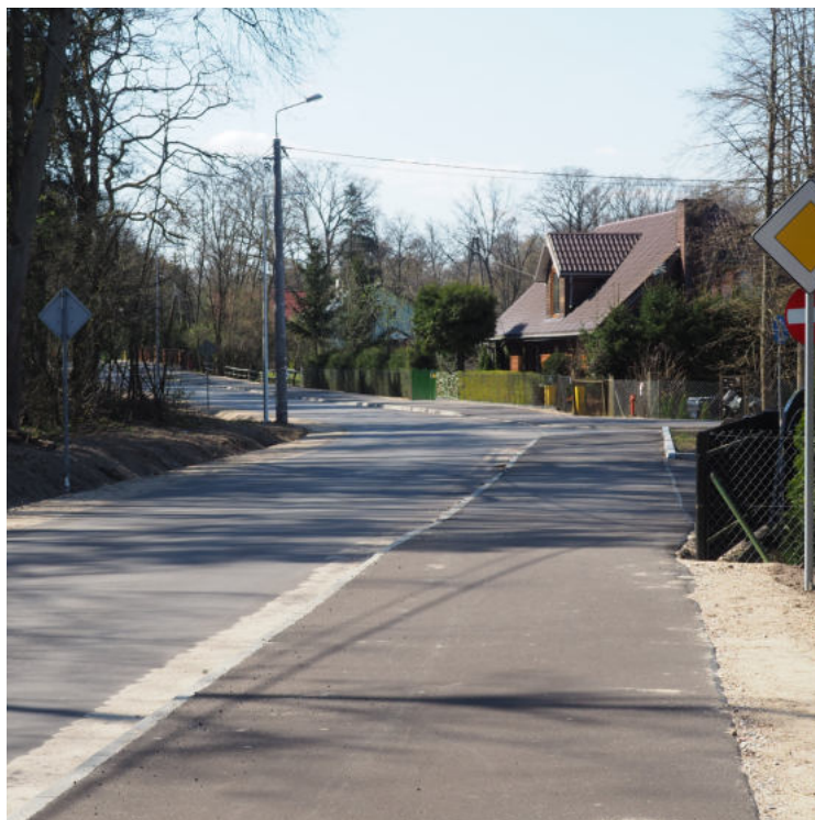
Na zdjęciu: Droga gminna w msc. Przystań