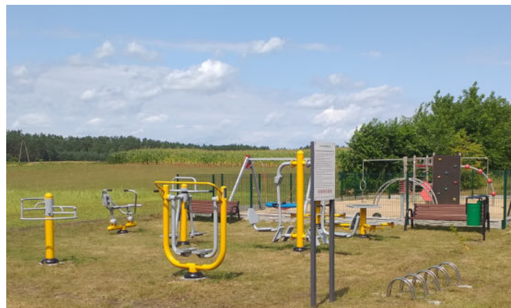
Na zdjęciu: Strefa Aktywności Fizycznej w msc. Żebry-Stara Wieś