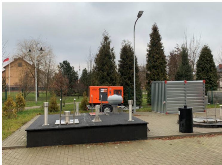
Na zdjęciu: Przepompownia ścieków w msc. Olszewo-Borki

Wymieniane zostały płyty pokryw i włazy tych studni kanalizacyjnych, które zostały wyposażone w nowoczesne pompy. Każda z nich zyskała nowe zasilanie i odrębne sterowanie, które będzie można realizować zdalnie. Dzięki wykorzystaniu technologii gsm w przypadku awarii którejś z pomp informacja o tym zdarzeniu zostanie natychmiast przekazana do Zakładu Gospodarki Komunalnej.