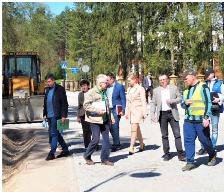
Na zdjęciu: Odbiór drogi gminnej w msc. Przystań

Ze względu na zabytkowy charakter obiektu część prac prowadzona była pod nadzorem konserwatora zabytków.