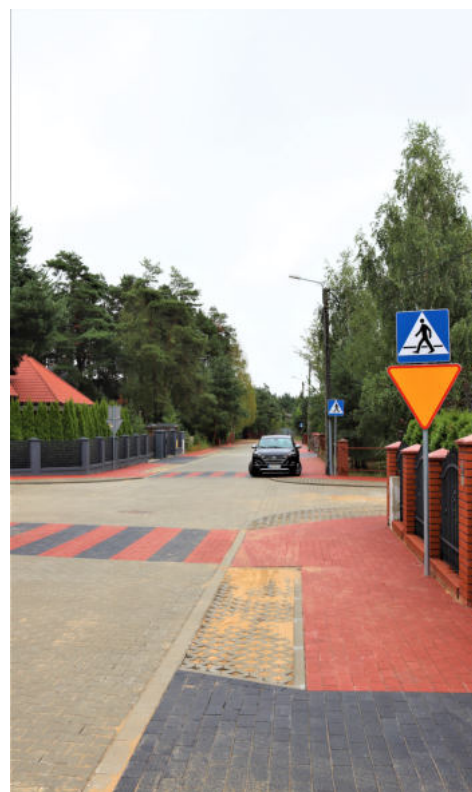
Na zdjęciu: Ulica Marsowa w msc. Zabrodzie

Łączny koszt powyższych inwestycji to 2 260 000,00 złotych.