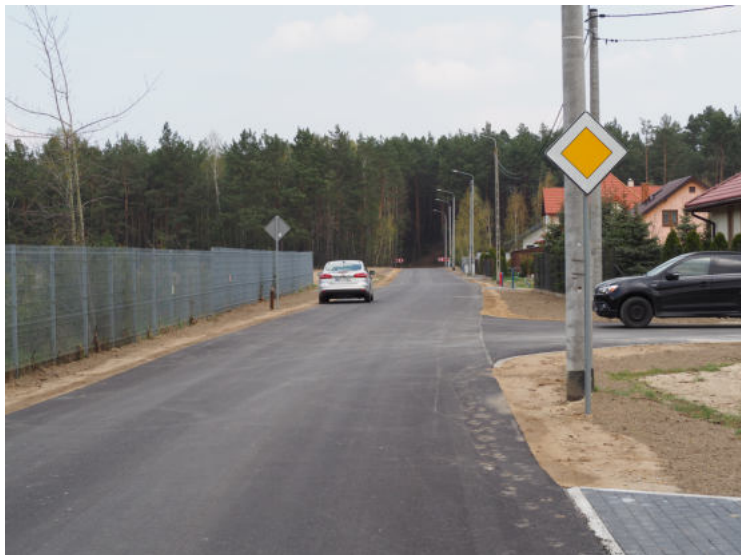
Na zdjęciu: Ulica Nowa w msc. Antonie