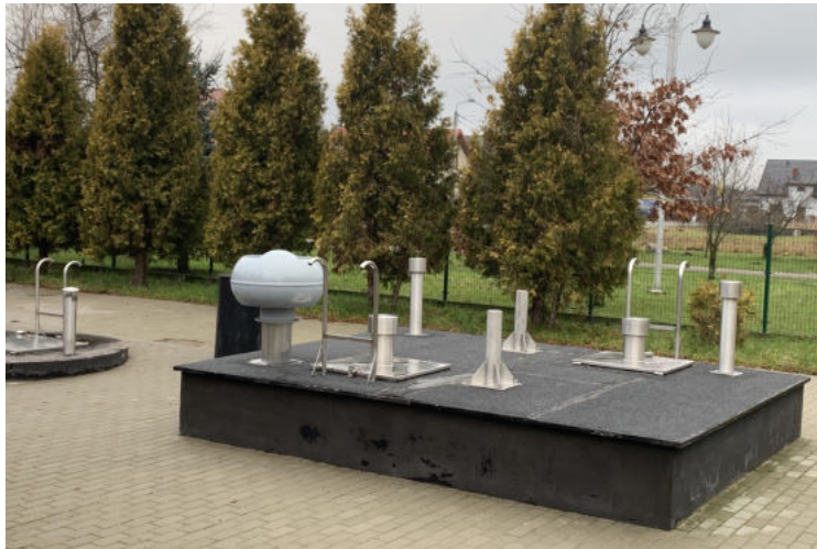
Na zdjęciu: Nowa przepompownia ścieków w msc. Olszewo-Borki