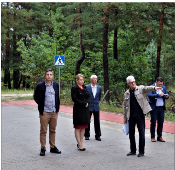
Na zdjęciu: Odbiór ul. Marsowej w msc. Zabrodzie

Ulice Malczewskiego, Kossaka i Witkiewicza w Olszewie-Borkach oraz ulica Marsowa w Zabrodziu zostały przebudowane. Prace budowlane trwały 8 miesięcy. Oba zadania były dofinansowane z rządowego Funduszu Dróg Samorządowych w wysokości 75 % ich wartości. Oficjalny odbiór robót budowlanych odbył się 31 sierpnia ubiegłego roku.