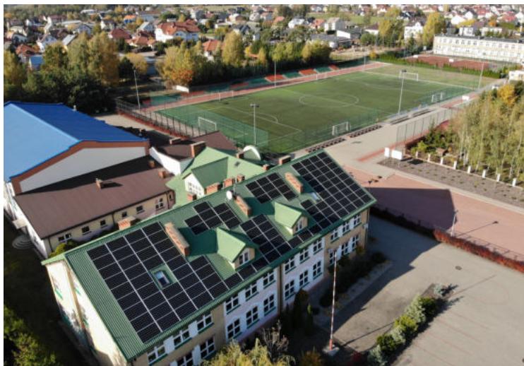
Na zdjęciu: Instalacja fotowoltaiczna na budynku S.P w Olszewie-Borkach