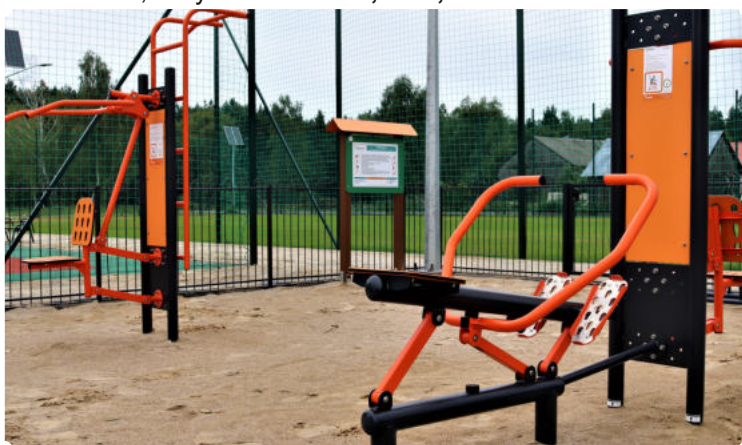
Na zdjęciu: Urządzenia do ćwiczeń znajdujące się w Kompleksie Sportowym w msc. Stepna Stara