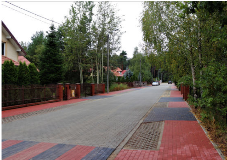
Na zdjęciu: Ulica Marsowa w msc. Zabrodzie