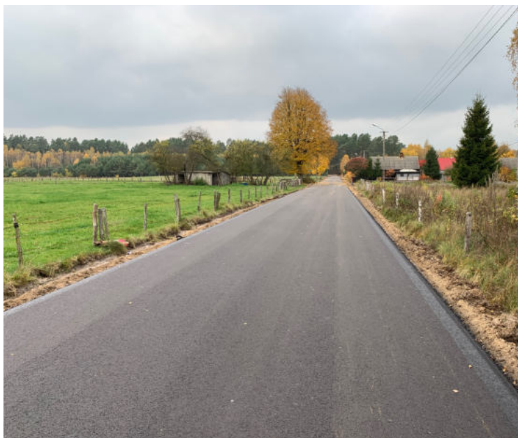
Na zdjęciu: Droga gminna w msc. Mostowo

Wartość inwestycji wyniosła 539 588, 70 złotych, w tym wartości dofinansowania w ramach rządowego Funduszu Dróg Samorządowych stanowi 70 % wartości kosztów kwalifikowanych.